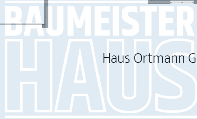
Haus Ortmann Grundriss KG bemasst